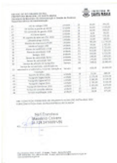
ORÇAMENTO PREF STA MARIA 02.jpg 223K