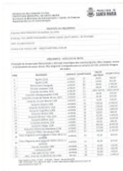
ORÇAMENTO PREF STA MARIA.jpg 265K