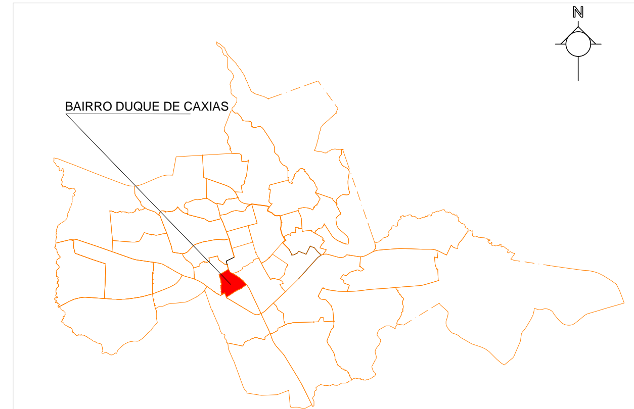
PLANTA DE SITUAÇÃO - CIDADE SEM ESCALA