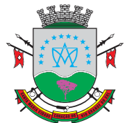
Prefeitura Municipal de Santa Maria